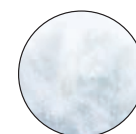
ACOLCHADO CON FIBRAS HIPOALERGÉNICAS