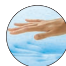
VISCOELÁSTICA CON GEL