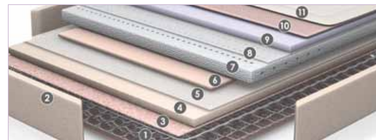
1. Muelle Continuo Multielástico® NxT 2. Encapsulado 3. Filtro 4. Confort System+® 5. Textil NT 6. Poliéter reciclable 7. Bloque de AirVex® AirPlus 8. Textil NT 9. Sistema Commodo+® 10. Viscoelástica 11. Tapicería Stretch con tecnología Optigrade®